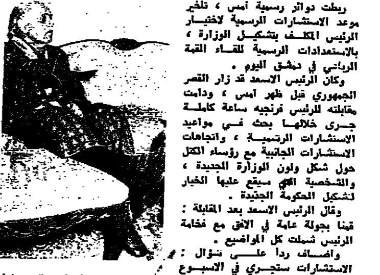
الرئيس سلام في صالون منزله امس

ربطت دوائر رسمية امس ، تأخر موعد الاستشارات الرسمية لاختصار الرئيس الكلف بتشكيل الوزارة ، بالاستعدادات الرسمية للقاء القمة الرئاسي في دمشق اليوم . وكان الرئيس الاسد قد زار القصر الجمهوري قبل ظهر امس ، ودايت مقابلته للرئيس فرنجييه ساعة كاملة جرى خلالها بحث نسي مواعيد الاستشارات الرسمية ، واتجاهات الاستشارات الجانبية مع رؤساء الكتل حول شكل ولون الوزارة الجديدة ، والخصخصة التي سيخضع عليها الخبار لتشكيل الحكومة الجديدة . وقال الرئيس الاسد بعد المقابلة : قمنا بجملة عامة في الاق مع فخامة الرئيس شملت كل المواضيع . وان شاء ردا على سؤال الاستشارات ستجري في الاسبوع المقبل ، ولكن بعد يوم الاثنين . وسئل اذا كان يتوقع ازمة وزارية ، فاجاب : دائما كنا نقول ان الامور يجب ان تسي في جوارها الطبيعي ، واليوار تضي الى انه لا يمر للخوف من وقوع ازمة . وسئل عن مواصفات رئيس الحكومة المقبل ، فاجاب : اننا نقت انه يجب ان تشكل حكومة قوية ، وقوتها يتجسها ، ومدى تفهيمها كجديس الفئات اللبنانية . وطبعاً رئيس الحكومة يجب ان يتحلى بهذه الصفات . وسئل الاسد اذا كان يعتقد بان الرئيس صائب سلام هو الارضي هذا لتشكيل الوزارة ، فاجاب : « شو الصفة قصة مواصفات ، مشترى - البقية على ص ٨ عود ٢ -